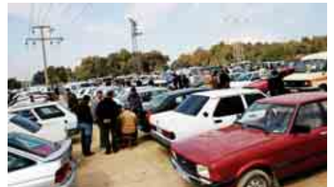
ÖTV indiriminin yansımadığı oto pazarında ikinci el araçlar sıfırından pahalıya satılıyor. Araçların için değerinin üstünde fiyat isteyen satıcılar pazarlıkta indirim yapıyor.